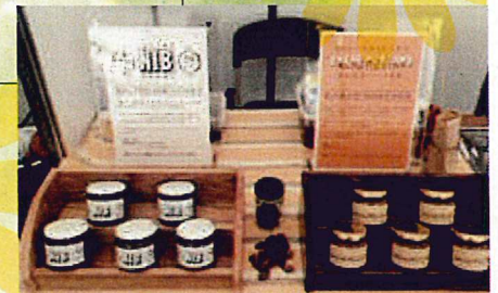
ニブハニー・カカオマスタード 事業所：タイムレスチョコレート