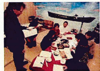
伊平屋押し寿司の開発風景