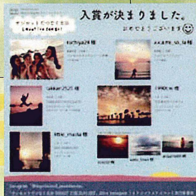
フォトコンテスト結果