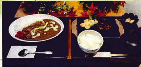
アーサカレー・アーサハンバーグ 事業所：北谷町漁業協同組合