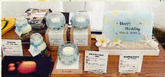
キャンドルシリーズ 事業所：ビタミン・キャンドル