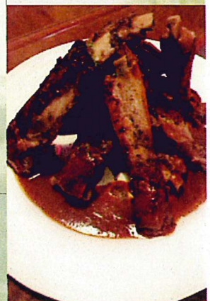
スベアリップ 事業所：ケイズプロジェクト