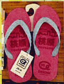
島そうり北谷ローカルシリーズ 事業所：(株)琉球ファクトリー