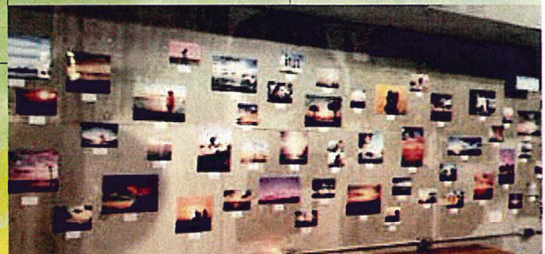
フォトコンテスト作品