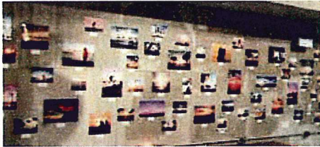
フォトコンテスト

北谷町「美浜」はサンセットの絶景地でサーファーが集う町でも一大名所である。商工会では美浜の愛着を結集し当地をテーマにフォトコンテストを実施した。募集方式にInstagramを活用したところ国内外から約300点の応募があり、そのうち数点の受賞作品を選定した。