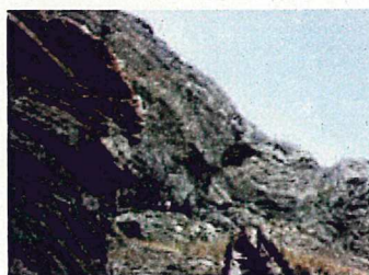
聖地である「天岩戸」 (クマヤー洞穴)

平成28年3月1日、伊平屋島年頭平松が国指定天然記念物に昇格した。その他、聖地である「天岩戸(クマヤー洞穴)」(県指定天然記念物)、琉球王朝第一尚氏元祖屋蔵大主の墓などの歴史的価値の高い観光名所に加え、ローカルな観光名所を追加して来訪者誘致を手掛けている。本村の農林水産業は、山々の湧水を恵みである伊平屋米の栽培と沖縄の高級魚ミーバイ(ヤイトハタ:沖縄県産品)として指定を受けており、大東寿司からヒントを得て農水産品をコラボした「伊平屋押し寿司」、の試作品を開発し試作品・品評報告会を開催した。